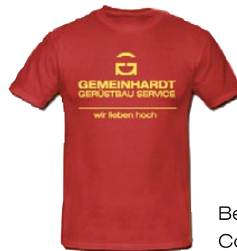
Beispiele aus unserem neuen Corporate Design.